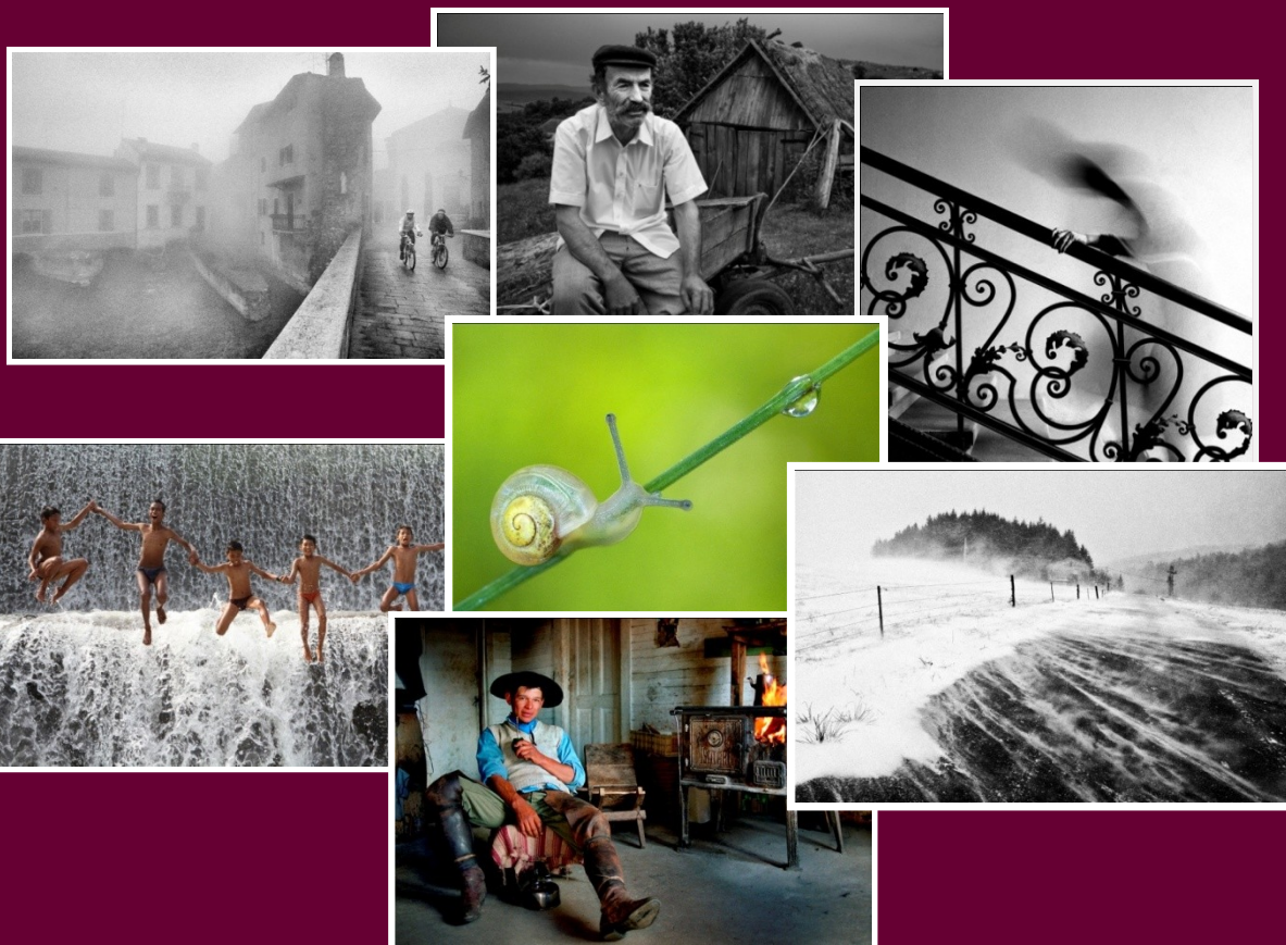
Photo Camp of Photographers from 5 Countries